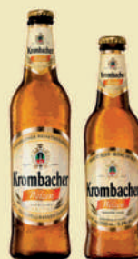
steklenica 0,5l steklenica 0,33l