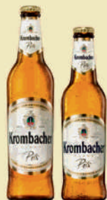
steklenica 0,5l steklenica 0,33l